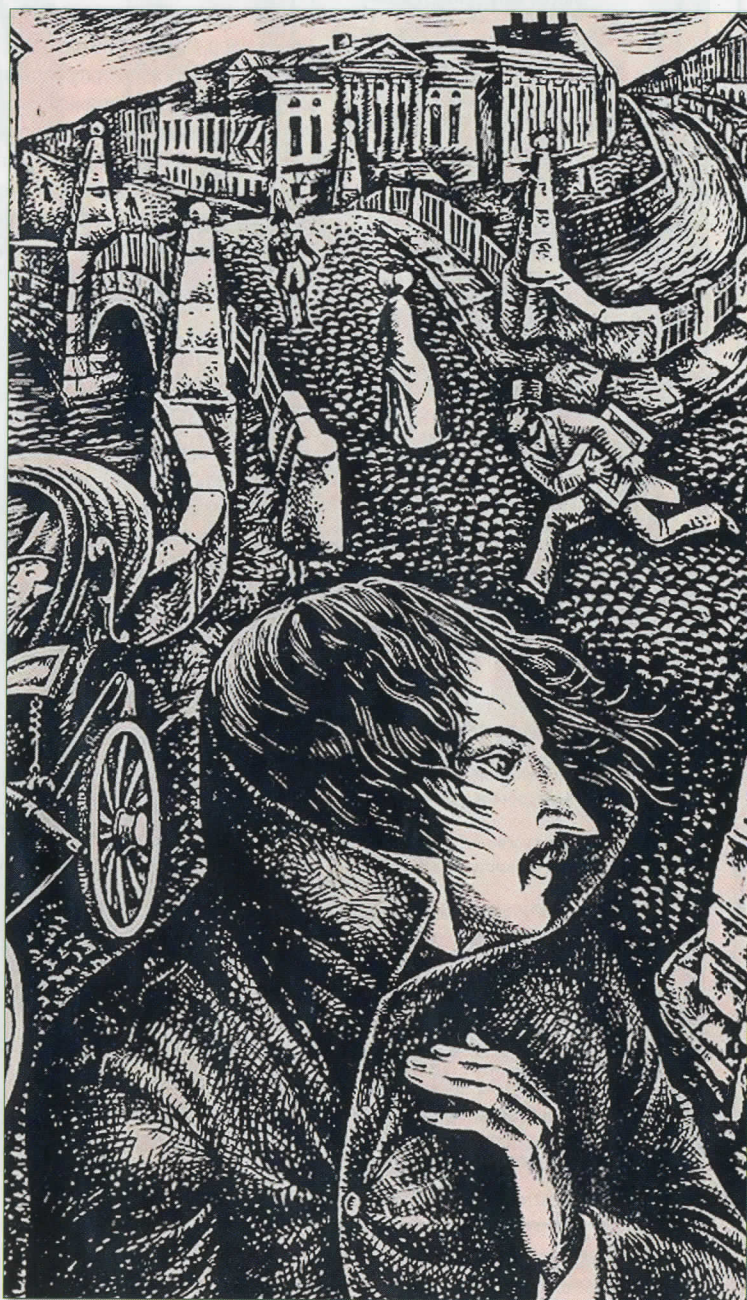
Н.М.Ромадин. Н.В.Гоголь. 1978